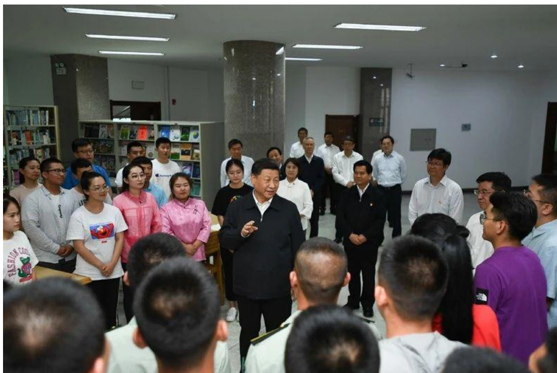
7月15日至16日，中共中央总书记、国家主席、中央军委主席习近平在内蒙古考察并指导开展“不忘初心、牢记使命”主题教育。这是16日，习近平在位于呼和浩特市内蒙古大学看望师生代表。